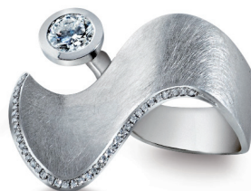
Platinring „Diamond Wave“ mit einem Solitärbrillanten und 40 kleinen Diamanten von Stephanie Henzler

„Meine Vision ist es, jeden Tisch und jede Tafel in eine perfekt anmutende Szenerie zu verwandeln.“